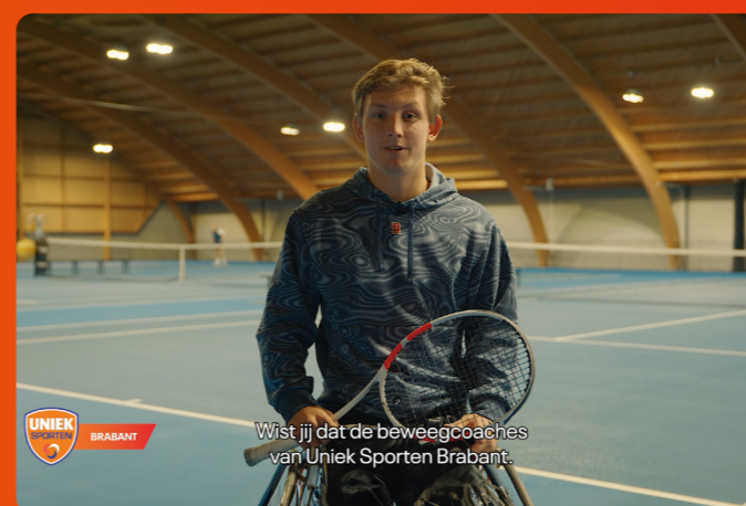
Wist jij dat de beweegcoaches van Uniek Sporten Brabant.

In navolging van de koffietour langs de Brabantse ziekenhuizen ontwikkelden we een speciaal communicatiepakket. In dit pakket troffen de ziekenhuizen kant-en-klare materialen die zijn via verschillende kanalen kunnen inzetten. Daarnaast was het pakket een uitnodiging om de samenwerking nog meer op te zoeken.