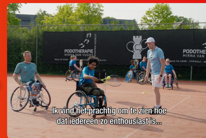
Ik vind het prachtig om te zien hoe dat iedereen zo enthousiast is...