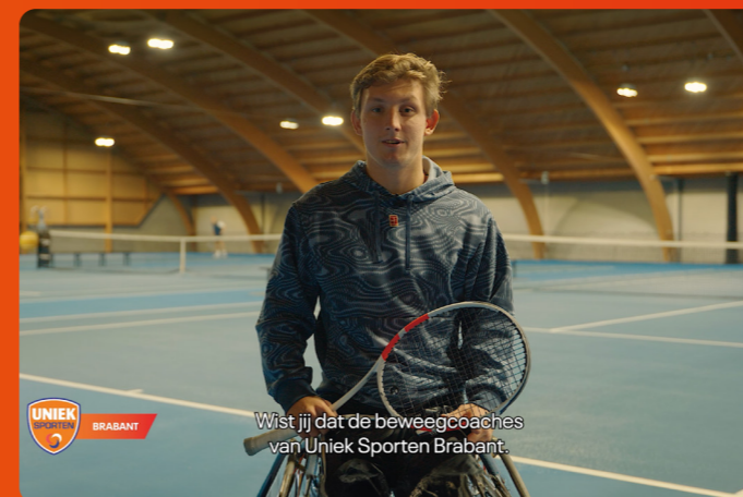
Wist jij dat de beweegcoaches van Uniek Sporten Brabant.

In navolging van de koffietour langs de Brabantse ziekenhuizen ontwikkelden we een speciaal communicatiepakket. In dit pakket troffen de ziekenhuizen kant-en-klare materialen die zijn via verschillende kanalen kunnen inzetten. Daarnaast was het pakket een uitnodiging om de samenwerking nog meer op te zoeken.