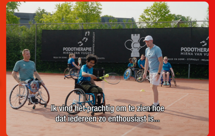
Ik vind het prachtig om te zien hoe dat iedereen zo enthousiast is...